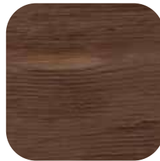
ÜRÜN KODU: CEVİZ