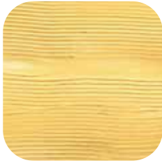
ÜRÜN KODU: KEHRİBAR