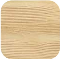
ÜRÜN KODU: ELMA