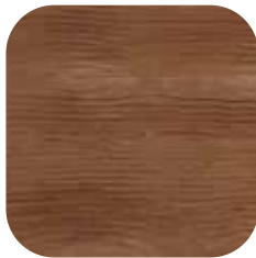
ÜRÜN KODU: MEŞE