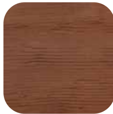
ÜRÜN KODU: KAYIN