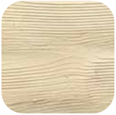
ÜRÜN KODU: AKÇAĞAÇ