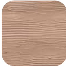
ÜRÜN KODU: GÜL