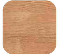
ÜRÜN KODU: AÇIK MEŞE