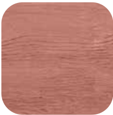
ÜRÜN KODU: KIRAZ