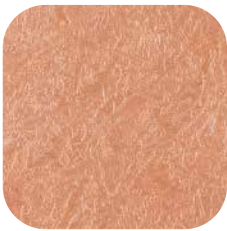
ÜRÜN KODU: P20