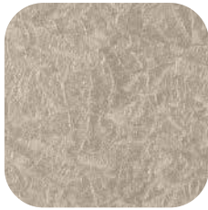
ÜRÜN KODU: P90