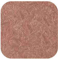
ÜRÜN KODU: P30