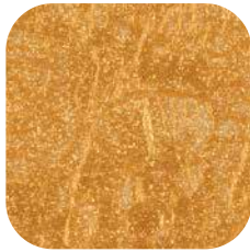
ÜRÜN KODU: VARAK