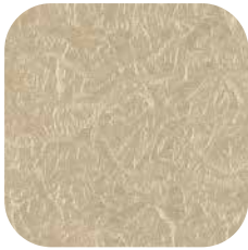
ÜRÜN KODU: P80