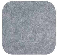
ÜRÜN KODU: P60