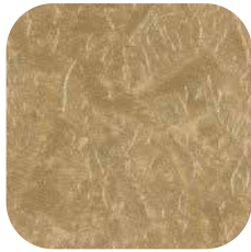
ÜRÜN KODU: P100