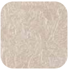
ÜRÜN KODU: GÜMÜŞ BAZ