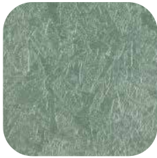
ÜRÜN KODU: P70