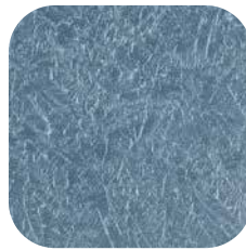
ÜRÜN KODU: P50