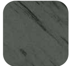
ÜRÜN KODU: ANTRASİT