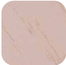
ÜRÜN KODU: ES-60