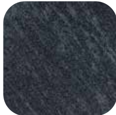
ÜRÜN KODU: SIYAH