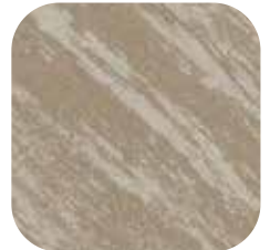
ÜRÜN KODU: ES-1