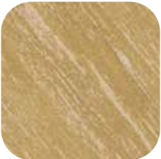
ÜRÜN KODU: VARAK