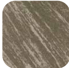
ÜRÜN KODU: ES-80