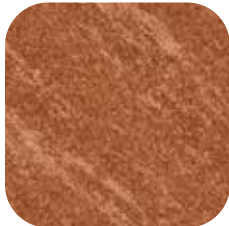
ÜRÜN KODU: BRONZ