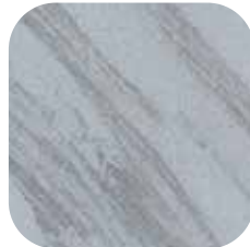
ÜRÜN KODU: METALİK