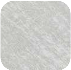
ÜRÜN KODU: GÜMÜŞ BAZ